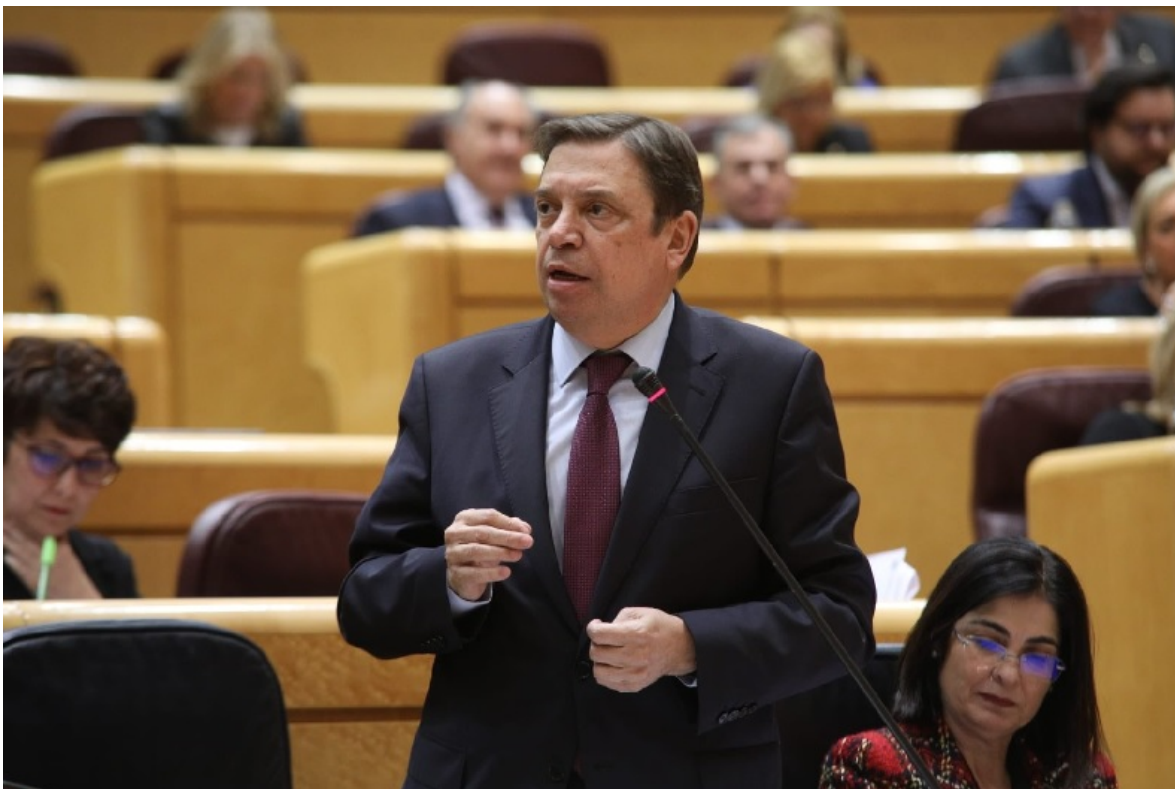
El ministro de Agricultura, Pesca y Alimentación, Luis Planas.

El ministro de Agricultura, Pesca y Alimentación , Luis Planas , ha pedido a las comunidades autónomas que intensifiquen los controles ante los posibles incumplimientos de la Ley de la Cadena Alimentaria, recientemente modificada por el Gobierno.