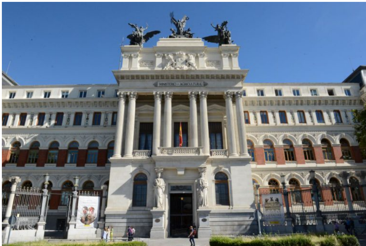
Imagen del exterior del Ministerio de Agricultura

El Consejo de Ministros aprobó este martes -3 de marzo- un Real Decreto por el que se aprueba la estructura orgánica básica del Ministerio de Agricultura, Pesca y Alimentación (MAPA), en el que se detalla la organización, competencias y unidades del Departamento.