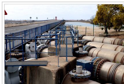
Imagen del puente sifón de Santa Eulalia en el río Odiel (Huelva)

Con las labores de mejora, la Consejería de Desarrollo Sostenible persigue asegurar el agua de consumo humano a 145.115 habitantes y reducir las fugas, preservando así el recurso suministrado por la infraestructura a los usuarios ubicados aguas abajo.